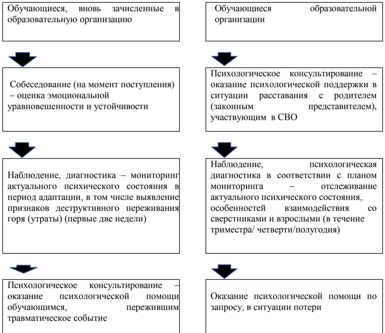
Схема Выстраивания работы педагогов по педагогическому сопровождению детей ветеранов (участников) СВО в зависимости от статуса пребывания обучающегося в образовательной организации